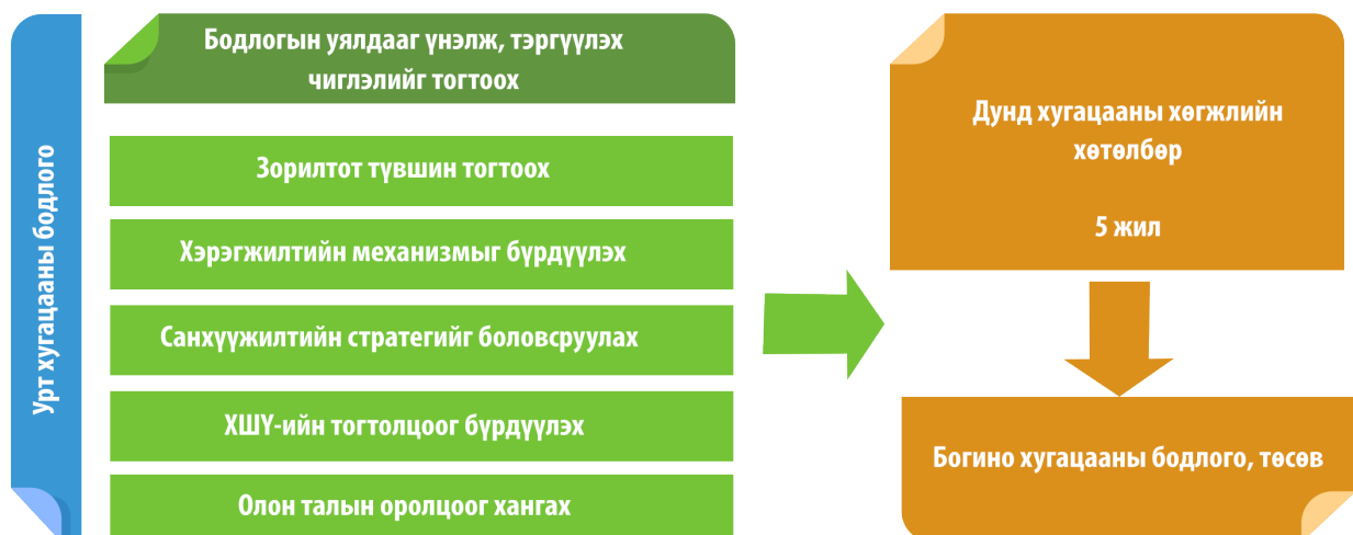
Зураг. Монгол Улсын урт хугацааны хөгжлийн бодлогыг ТХЗ-д нийцүүлэх замын зураглал

ТХЗ-ыг хэрэгжүүлэхэд хөгжлийн бодлогыг шинжлэх ухааны үндэслэлтэй, нэгдмэл цогц, олон талын оролцоог хангаж